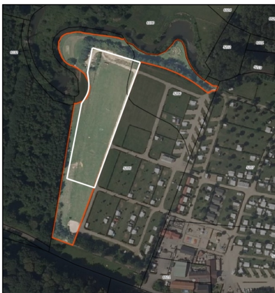
Figuur 1: begrenzing aanduiding 'natuurspeelplek' met rood omlijnd begrenzing conform ontwerp bestemmingsplan en wit omlijnd de nieuwe begrenzing