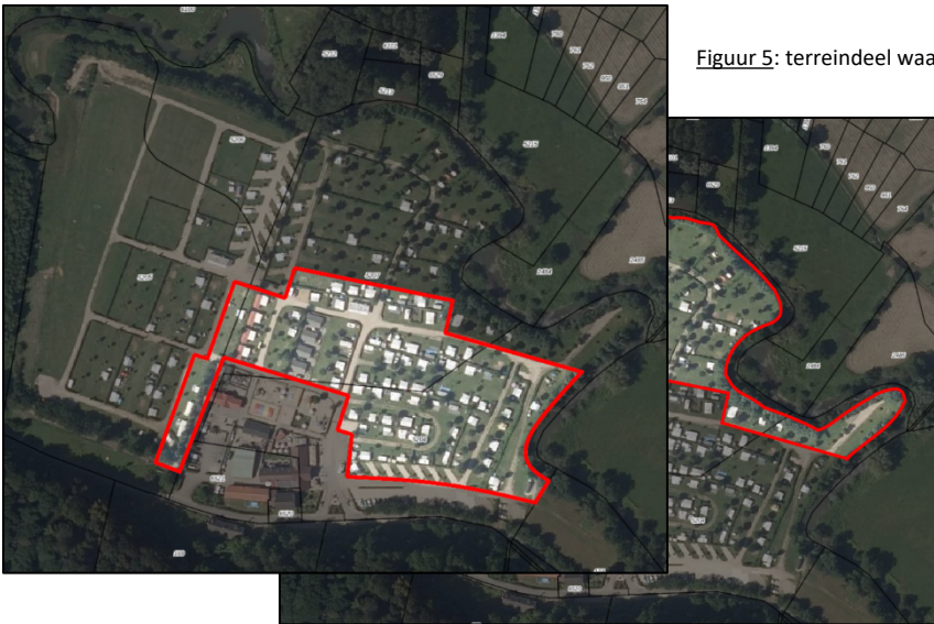
Figuur 5: terreindeel waar vaste staanplaatsen zijn toegestaan