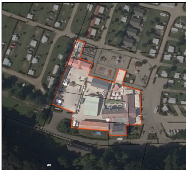
Figuur 4: grens bouwvlak waarbinnen uitsluitend gebouwen mogen worden gerealiseerd (tot een maximum van 3.750 m 2 ). Buiten dit bouwvlak zijn (binnen de bestemming 'Recreatie – Verblijfsrecreatie' uitsluitend ondergeschikte gebouwen ten behoeve van sanitaire voorzieningen toegestaan tot een maximum van 325 m 2

Het afzonderlijk beschouwen van drie kaartbeelden biedt in onze ogen geen enkele houvast voor de stelling van de SNG dat toegewerkt wordt naar een groot bebouwd vakantiepark. Het juridische gedeelte van een bestemmingsplan wordt gevormd door de digitale verbeelding en de regels. Zoals eerder in onze reactie onder 'zienswijze 2' toegelicht is het niet de intentie om een vakantiepark te realiseren, en wordt dit met een aanscherping in de juridische regeling extra kracht bij gezet. Ter verduidelijking wordt aan de hand van de volgende figuren inzichtelijk gemaakt binnen welk terreindeel gebouwen zijn toegestaan (het bouwvlak), binnen welk terreindeel vaste staanplaatsen (kampeermiddelen) zijn toegestaan, en het overige terreindeel waar uitsluitend seizoenskamperen (kampeermiddelen) is toegestaan.