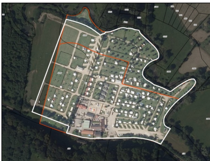
Figuur 3: begrenzing kampeerterrein met rood omlijnd begrenzing conform bestemmingsplan 'Buitengebied' en wit omlijnd de nieuwe begrenzing

In tegenstelling tot de SNG zijn wij van mening dat een advies van de Ambtelijke Themagroep Vrijetijdseconomie niet aan de orde is. Er is namelijk geen sprake van het realiseren van een bestemmingsplan dat meer kampeerplekken mogelijk maakt dan op grond van het bestemmingsplan 'Buitengebied 2013' reeds mogelijk zijn. Voorts is geen sprake van een omschakeling of transformatie van de bestaande camping (in bijvoorbeeld een bungalowpark o.i.d.). Ook het ruimtebeslag van het terrein waar gekampeerd kan worden blijft met het nieuwe bestemmingsplan nagenoeg gelijk; wel is sprake van een door te voeren vormverandering van het kampeerterrein zoals in onderstaande figuur gevisualiseerd. Een behoefteonderzoek en/of het aantonen van de dringende economische noodzaak is daarmee niet aan de orde.