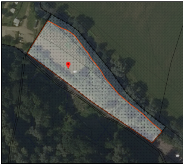
Figuur 7: bestemming 'Verkeer' (grondgebied Valkenburg aan de Geul) conform geldend bestemmingsplan en ontwerp bestemmingsplan

Naar aanleiding van een zienswijze van de provincie ten aanzien van dit perceel is door de gemeente Valkenburg aan de Geul de bestemmingswijze gewijzigd. Daarbij is het merendeel van de bestemming 'Verkeer' gewijzigd in 'Natuur', waarmee recht wordt gedaan aan de feitelijke situatie ter plekke. De resterende bestemming 'Verkeer' betreft het bestaand parkeerterrein.