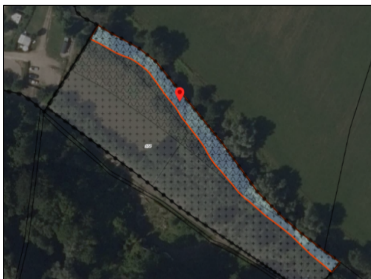
Figuur 10: bestemming 'Water' perceel P 174

In tegenstelling tot hetgeen in de toelichting staat vermeld is in het nieuwe bestemmingsplan geen sprake van de bestemming 'Water – Primair water' echter de bestemming 'Water'. De benaming bestemming 'Water – Primair water' geldt op grond van het ter plekke geldende bestemmingsplan van de gemeente Valkenburg aan de Geul. Qua begrenzing is deze gelijk aan de middels voorliggend bestemmingsplan opgenomen bestemming 'Water'. In de volgende afbeelding is dit deel rood omlijnd aangeduid op de verbeelding van het ontwerp bestemmingsplan.