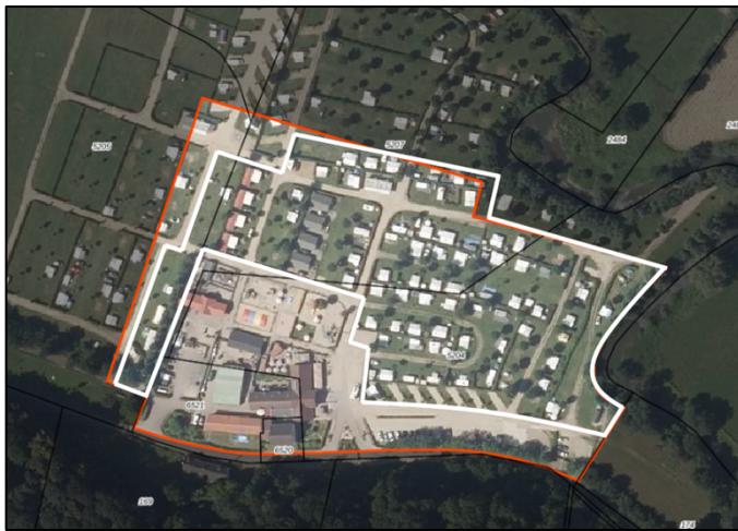
Figuur 2: begrenzing aanduiding 'vaste staanplaatsen' met rood omlijnd begrenzing conform ontwerp bestemmingsplan en wit omlijnd de nieuwe begrenzing

Ter plekke van de aanduiding 'vaste staanplaatsen' mogen de kampeermiddelen jaarrond aanwezig zijn en gebruikt worden. Voor het overige deel van de voor 'Recreatie – Verblijfsrecreatie' bestemde gronden is de aanwezigheid van kampeermiddelen, en daarmee ook