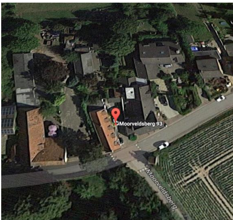
Luchtfoto Moorveldsberg 93, Geulle