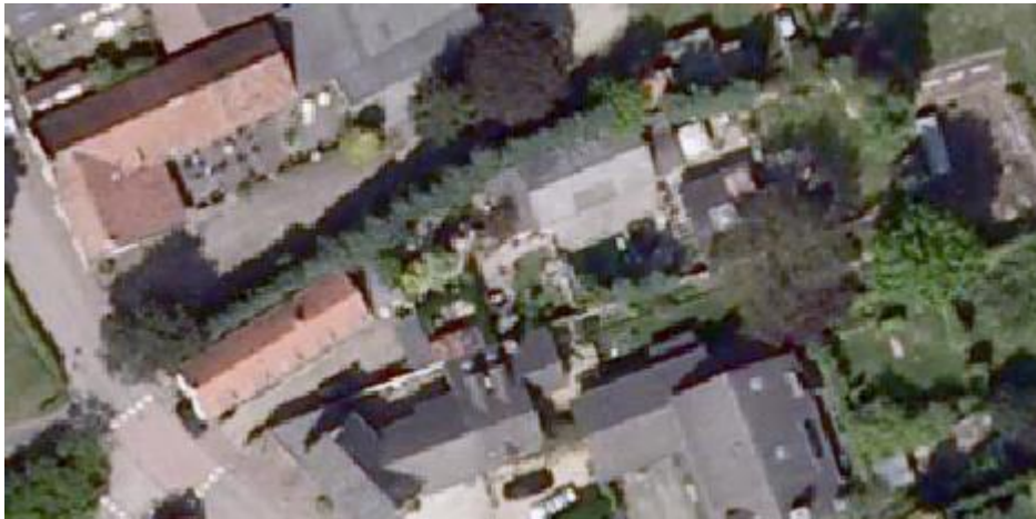
Luchtfoto 2009 Provincie Limburg

Onderhavige overtredingen zijn ontstaan vóór de relevante peildata. Er wordt dus voldaan aan beide peildata.