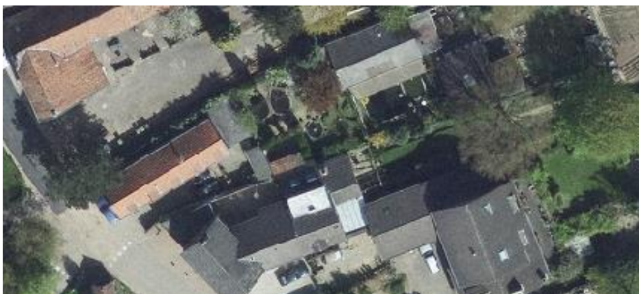
Luchtfoto 2016 Provincie Limburg