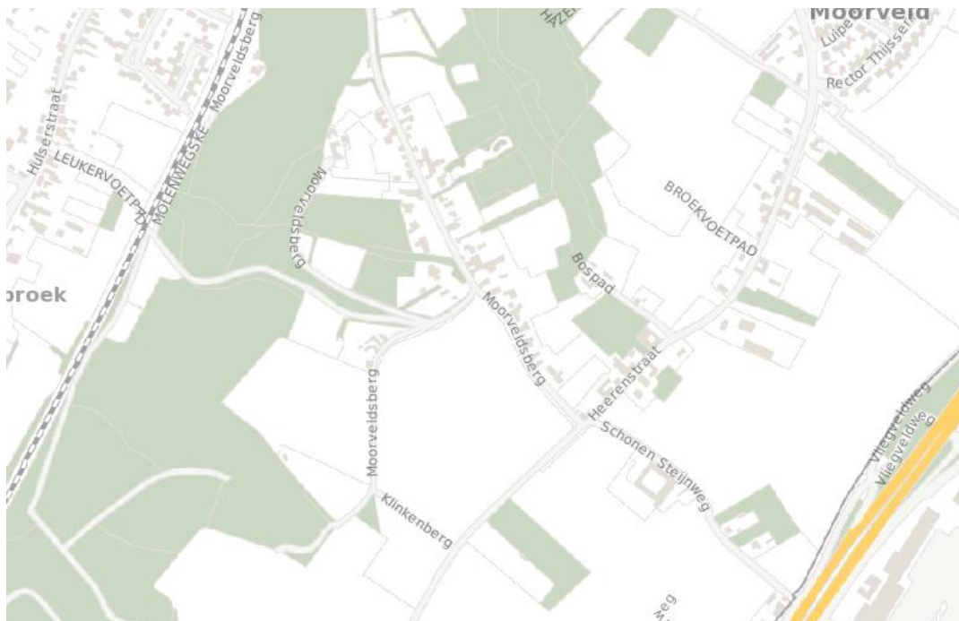
Uitsnede risicokaart met onderhavige locatie met blauw omcirkeld